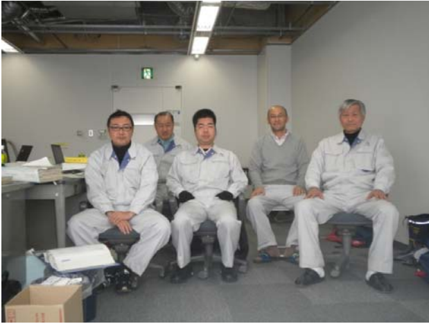
仙台塩釜港配属のT E