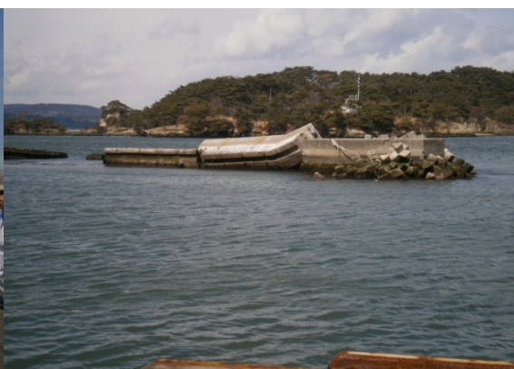
「代ヶ崎防波堤」(七ヶ浜町)