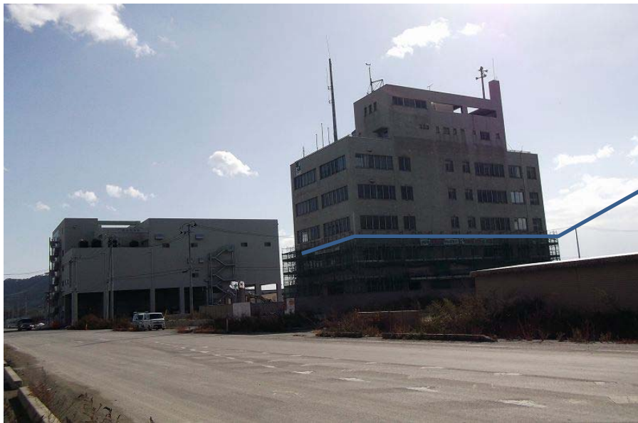
被災した 宮城県旧合同庁舎

積算設計にあつては、時間的制約もあり、標準断面による積算設計書であつたり、金額的制約で工区割設計書、応札関係による合併設計書等、多彩な設計書の作成が求められている。なお、併せて担当している現場管理業務にあつては、月例安全パトロールや主要箇所の現場立ち会い検査業務を行っている。