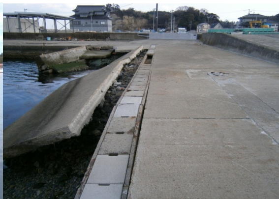
「花湊浜物揚場」(七ヶ浜町)