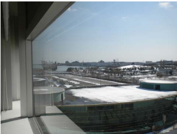
執務室から見た仙台港