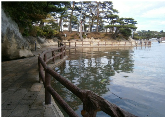
「松島海岸通り護岸」(松島町)