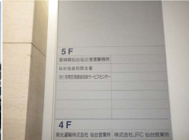
エレベーターホールの表示