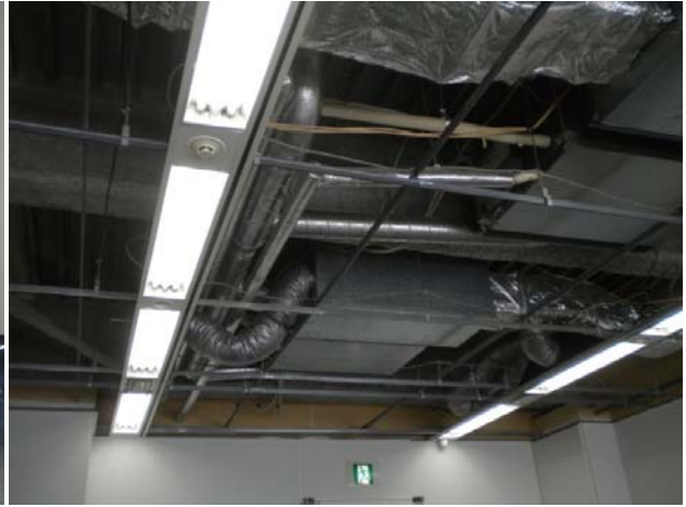
仙台塩釜港執務室の天井（地震で落下し、剥き出し状態）